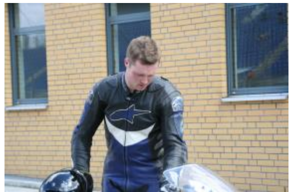
Eurospeedway Lausitz 7. + 8.7.07