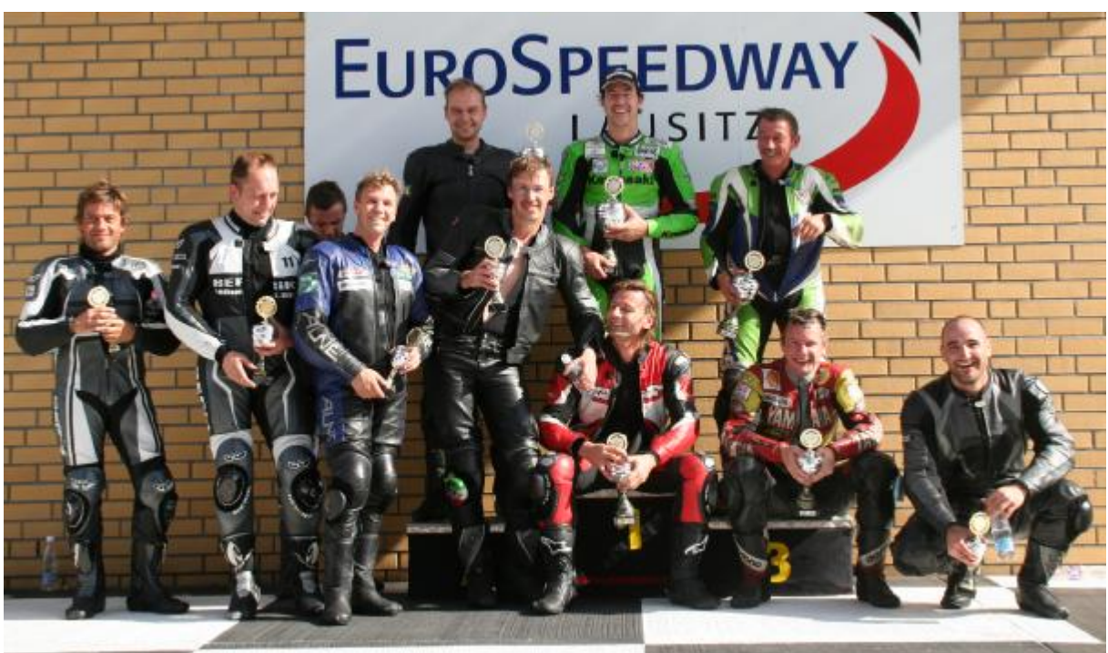
Eurospeedway Lausitz 7. + 8.7.07